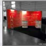
Akustik- und Messesysteme