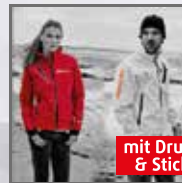
mit Druck & Stick