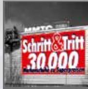
Werbeanlagen und Leitsysteme