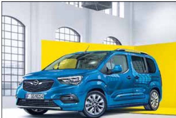
Abb. zeigt Sonderausstattungen.