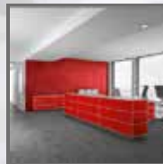
Oberflächen- und Sonnenschutzfolien